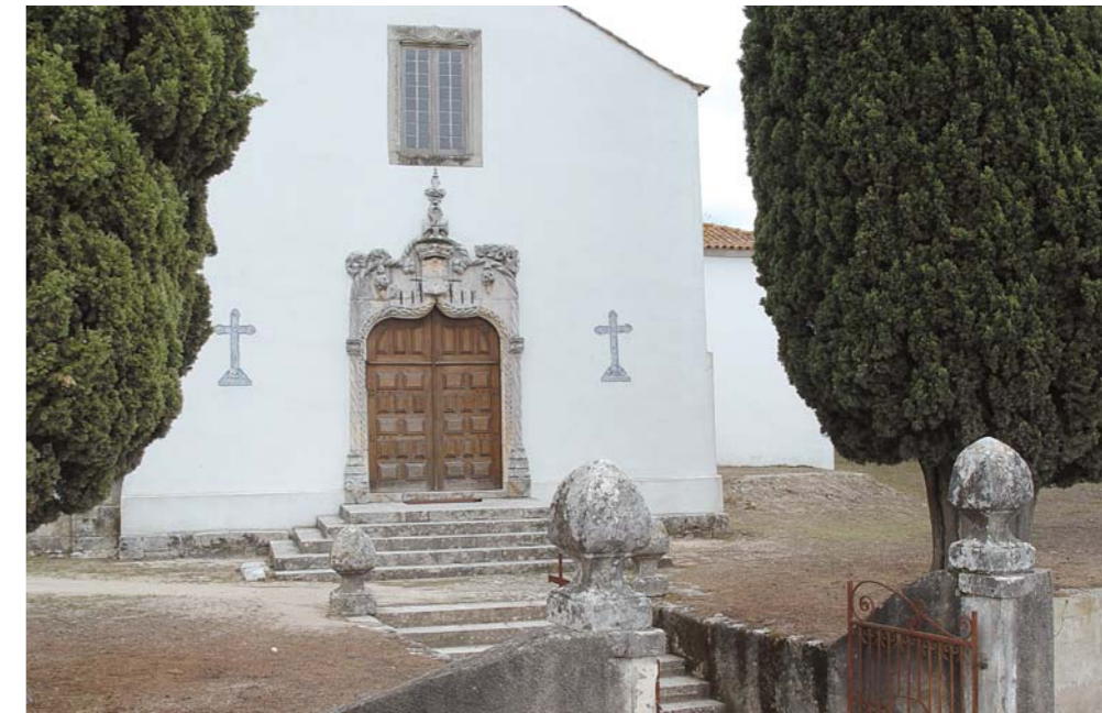
Câmara Municipal vai fazer obras no adro da Igreja Matriz

Ainda tenho como desejo a requalificação do adro da Igreja Matriz que se encontra num estado de degradação lastimável, sendo o pior que se encontra no Concelho de Condeixa. No entanto, sei que já existe intenção por parte da Autarquia para inverter esta situação. Outro dos meus desejos enquanto autarca seria presidir à inauguração de um Lar de Idosos pois, apesar de haver já um Centro de Dia com apoio domiciliário, a oferta é insuficiente para a Freguesia de Ega.