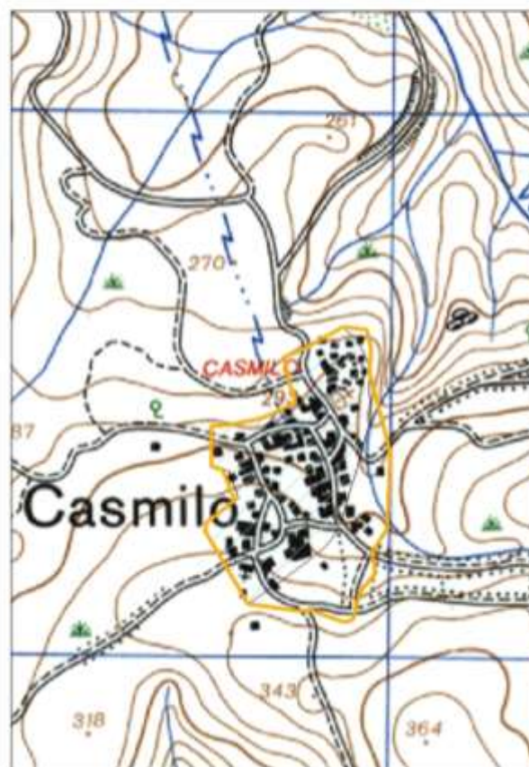
Localização do conjunto com interesse e carta militar relativa aos trabalhos de campo de 1978.